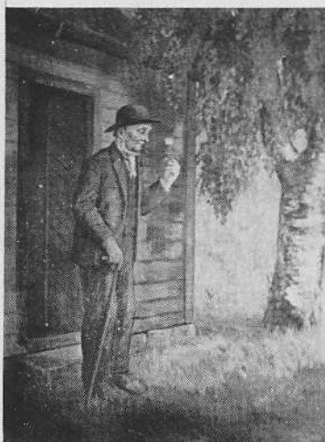
«Tett ved stova stod ei bjørk so breid»