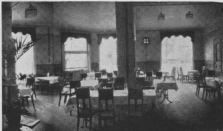
Til 1920 «Dampkjøkkenet», så «Matsalen Gimle» til 1924. I dag er det møbelforretning i lokalet.