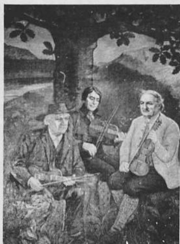
Dei tre store i folkemusikken: Sjur Helgeland til venstre, Myllarguten i midten og Ola Mosafinn til høgre